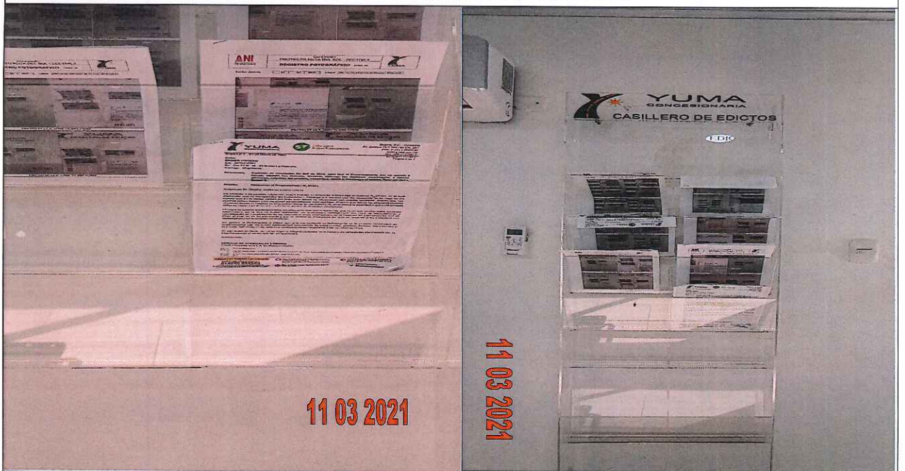
EDICTOS DE LA R_33361 YC-CRT-111961