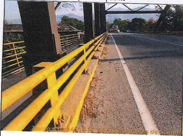
FOTO: 02 RUTA: 4518 SECTOR: PR 66+700 OBSERVACIONES: Limpieza de puente

FOTO: 01 RUTA: 4518 SECTOR: PR 66+700 OBSERVACIONES: Limpieza de puente