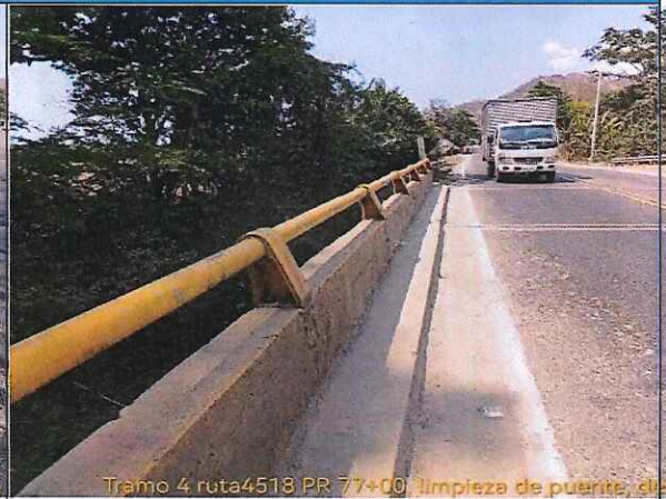
Tramo 4 ruta4518 PR 77+00, limpieza de puente, de

FOTO: 09 RUTA: 4518 SECTOR: PR 77+000 OBSERVACIONES: Limpieza de puente