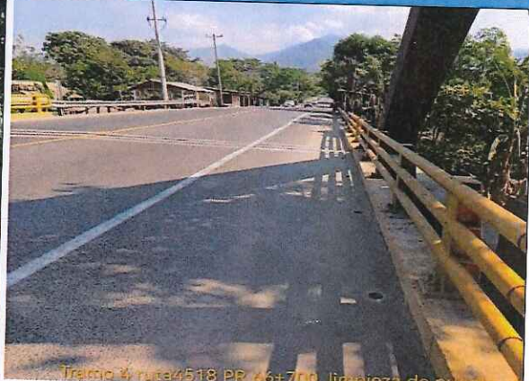
FOTO: 01 RUTA: 4518 SECTOR: PR 66+700 OBSERVACIONES: Limpieza de puente

FOTO: 02 RUTA: 4518 SECTOR: PR 66+700 OBSERVACIONES: Limpieza de puente