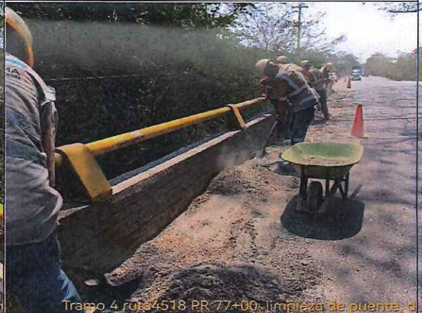
Tramo 4 ruta4518 PR 77+00, limpieza de puente, de

FOTO: 11 RUTA: 4518 SECTOR: PR 77+000 OBSERVACIONES: Limpieza de puente