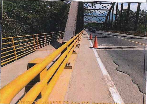
FOTO: 03 RUTA: 4518 SECTOR: PR 66+700 OBSERVACIONES: Limpieza de puente

FOTO: 04 RUTA: 4518 SECTOR: PR 66+700 OBSERVACIONES: Limpieza de puente