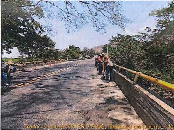
Tramo 4 ruta4518 PR 77+00, limpieza de puente, de

FOTO: 10 RUTA: 4518 SECTOR: PR 77+000 OBSERVACIONES: Limpieza de puente