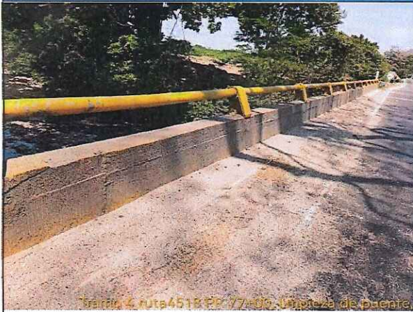
Tramo 4 ruta4518 PR 77+00, limpieza de puente,